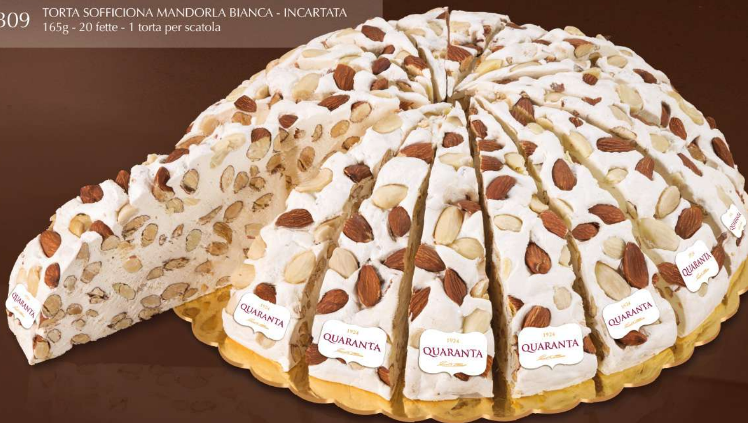
401309 TORTA SOFFICIONA MANDORLA BIANCA - INCARTATA 165g - 20 fette - 1 torta per scatola