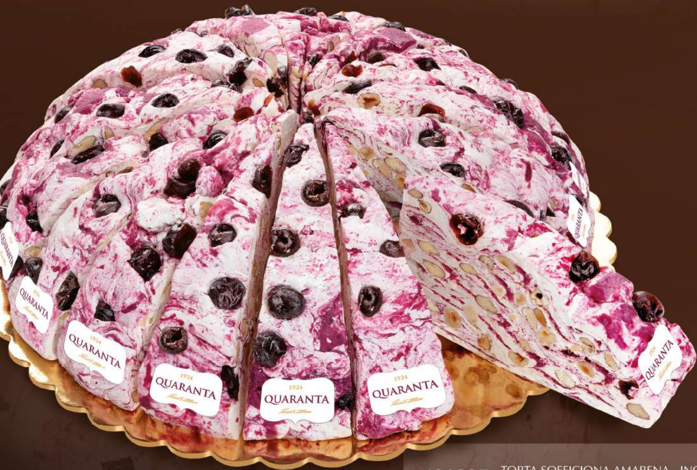
401287 TORTA SOFFICIONA AMARENA - INCARTATA 165g - 20 fette - 1 torta per scatola