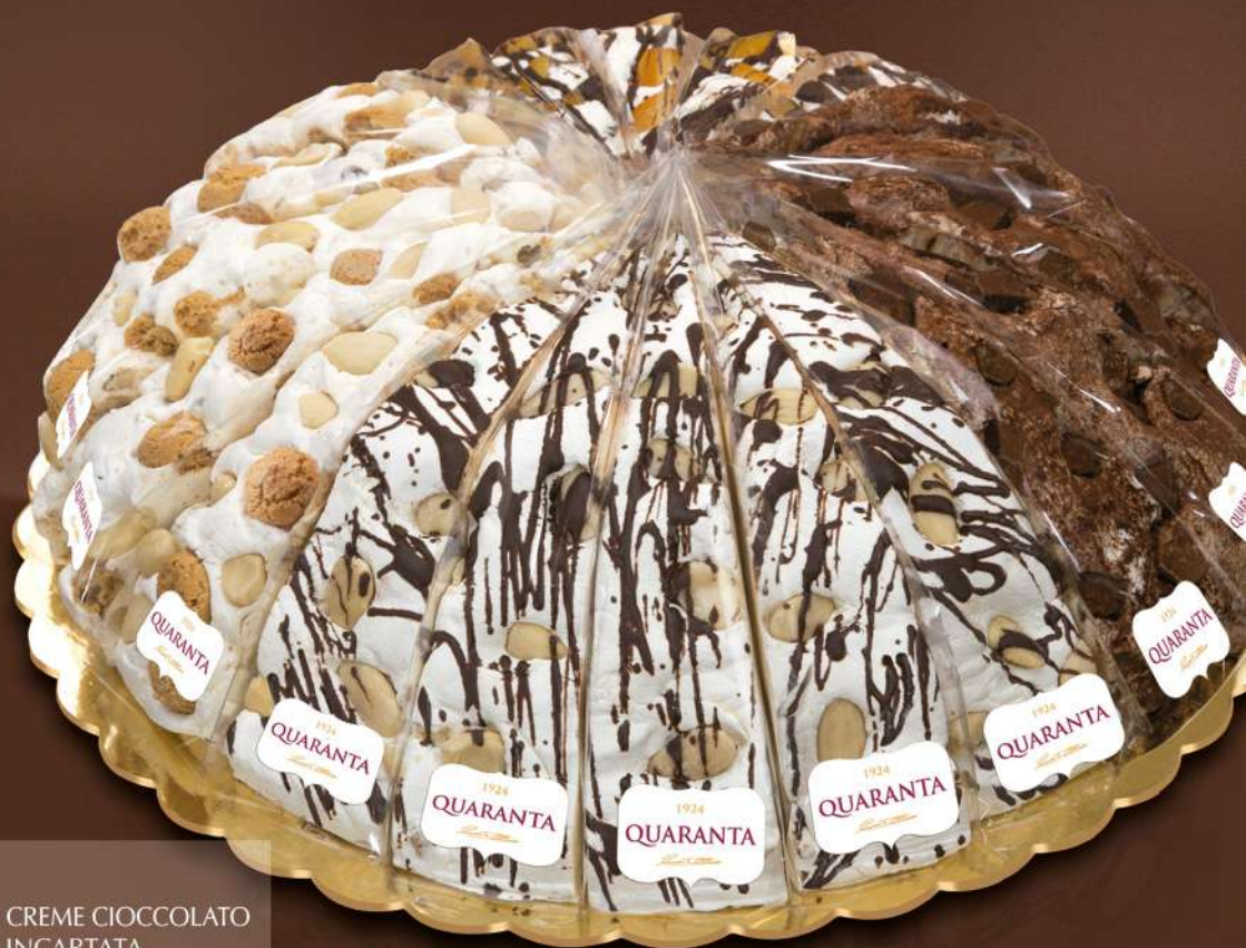
402864 TORTA SOFFICIONA CREME CIOCCOLATO GUSTI ASSORTITI - INCARTATA 165g - 20 fette - 1 torta per scatola