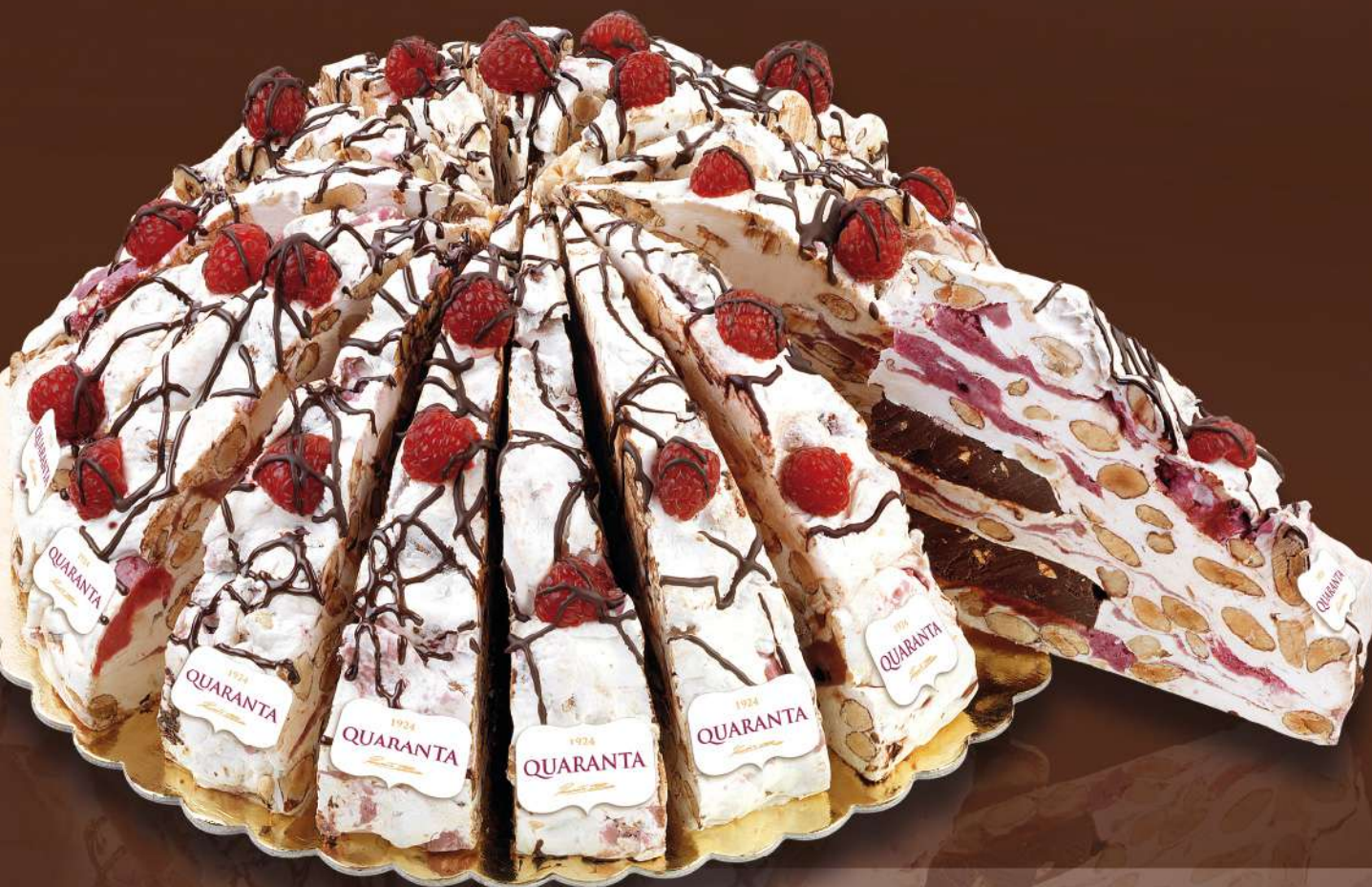
401377 TORTA SOFFICIONA LAMPONI E CIOCCOLATO FONDENTE - INCARTATA 165g - 20 fette - 1 torta per scatola