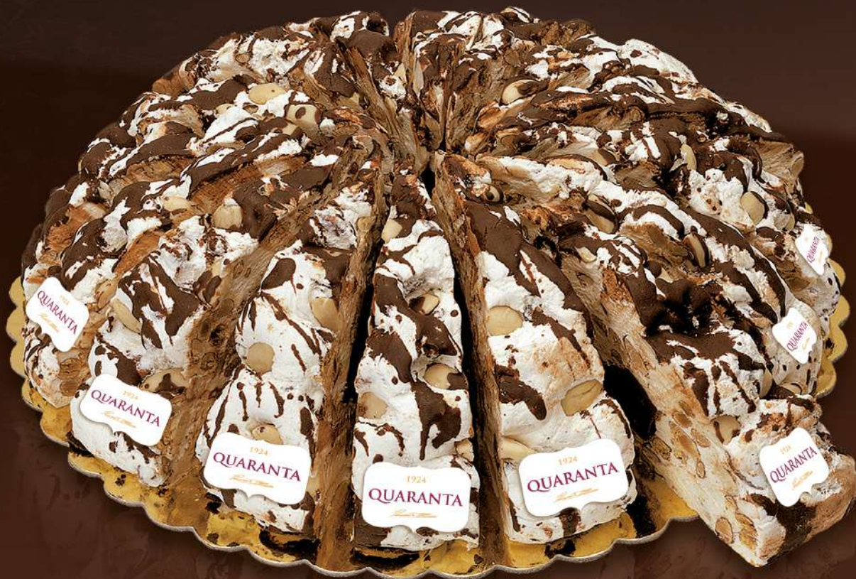
401491 TORTA SOFFICIONA CREMA NOCCIOLATO - INCARTATA 165g - 20 fette - 1 torta per scatola