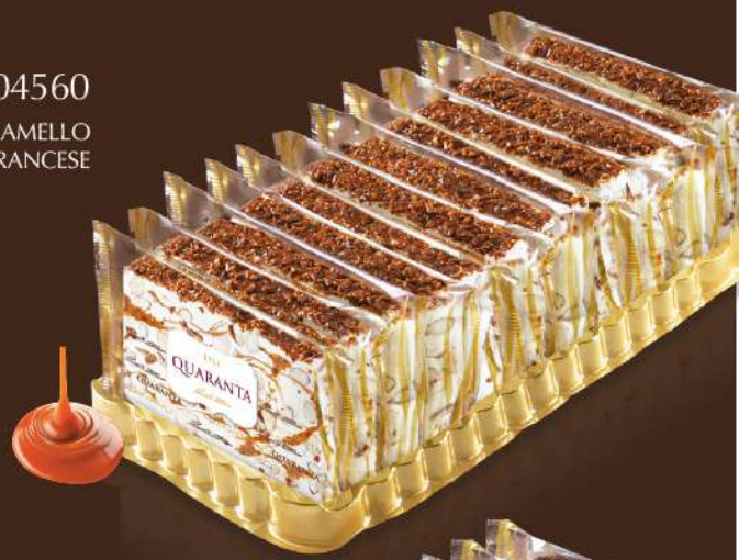
404560 CARAMELLO E PANNA FRANCESE