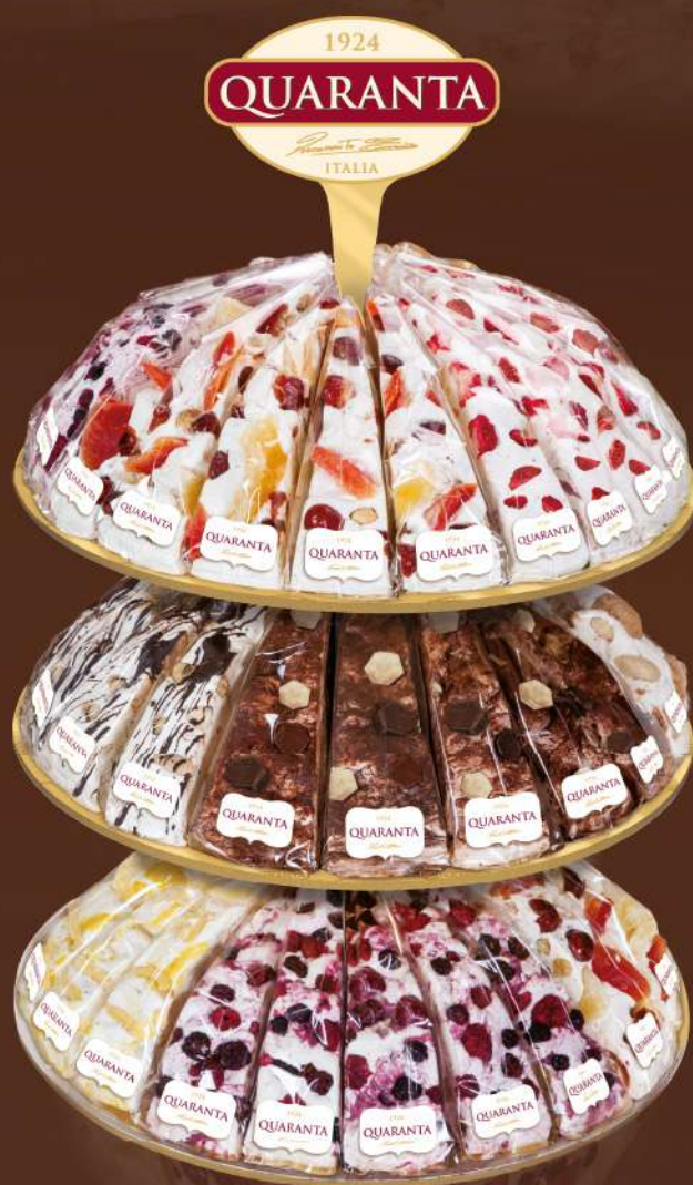
ESPOSITORE A TRE PIANI PER TORTA SOFFICIONA