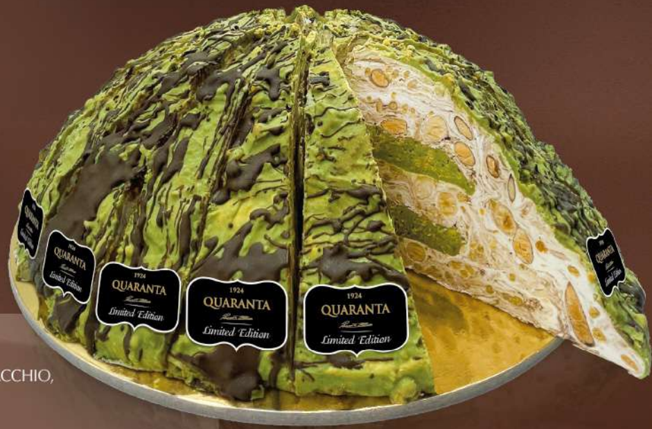
404969 TORTA SOFFICIONA CREMINO PISTACCHIO, MANDORLA E CIOCCOLATO 165 g - 20 fette - 1 torta per scatola