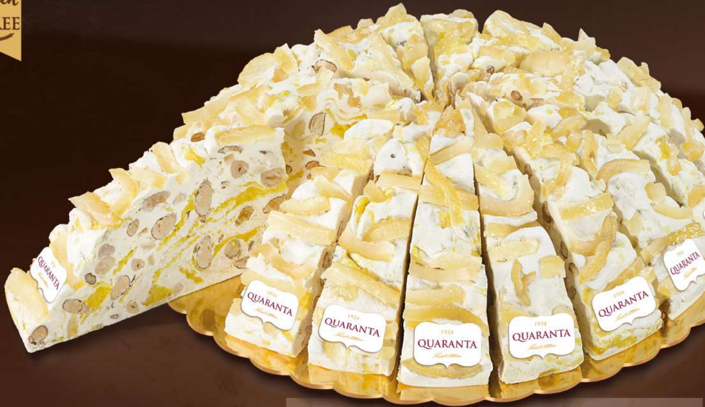
403944 TORTA SOFFICIONA LIMONE - INCARTATA 165g - 20 fette - 1 torta per scatola