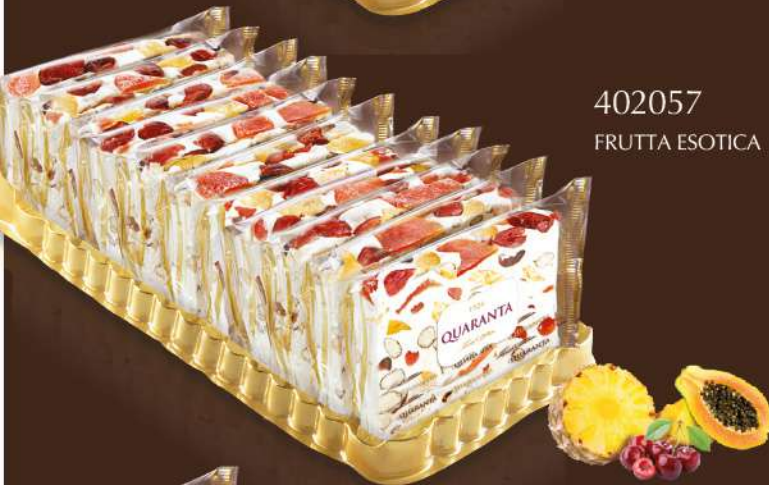
402057 FRUTTA ESOTICA