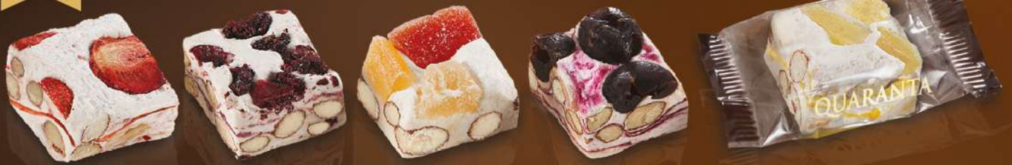
403908 BOCCONCINI CREME FRUTTA Fragola, Frutti di Bosco, Frutta Esotica, Amarena, Limone 900g - 3 buste per scatola