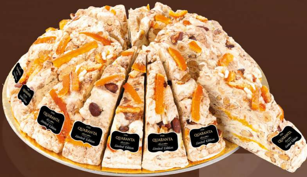
404858 TORTA SOFFICIONA AGRUMI, MANDORLE E CIOCCOLATO AL LATTE 165g - 20 fette - 1 torta per scatola