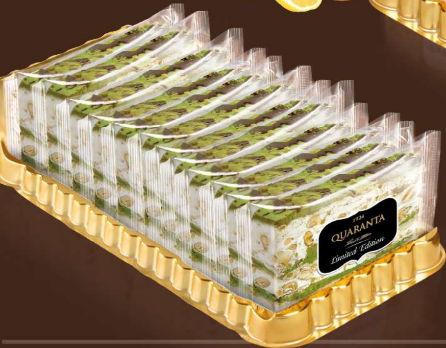
404968 CREMINO PISTACCHIO, MANDORLA E CIOCCOLATO

TRANCIO SOFFICIONA INCARTATO 150g - 12 fette - 1 trancio per scatola