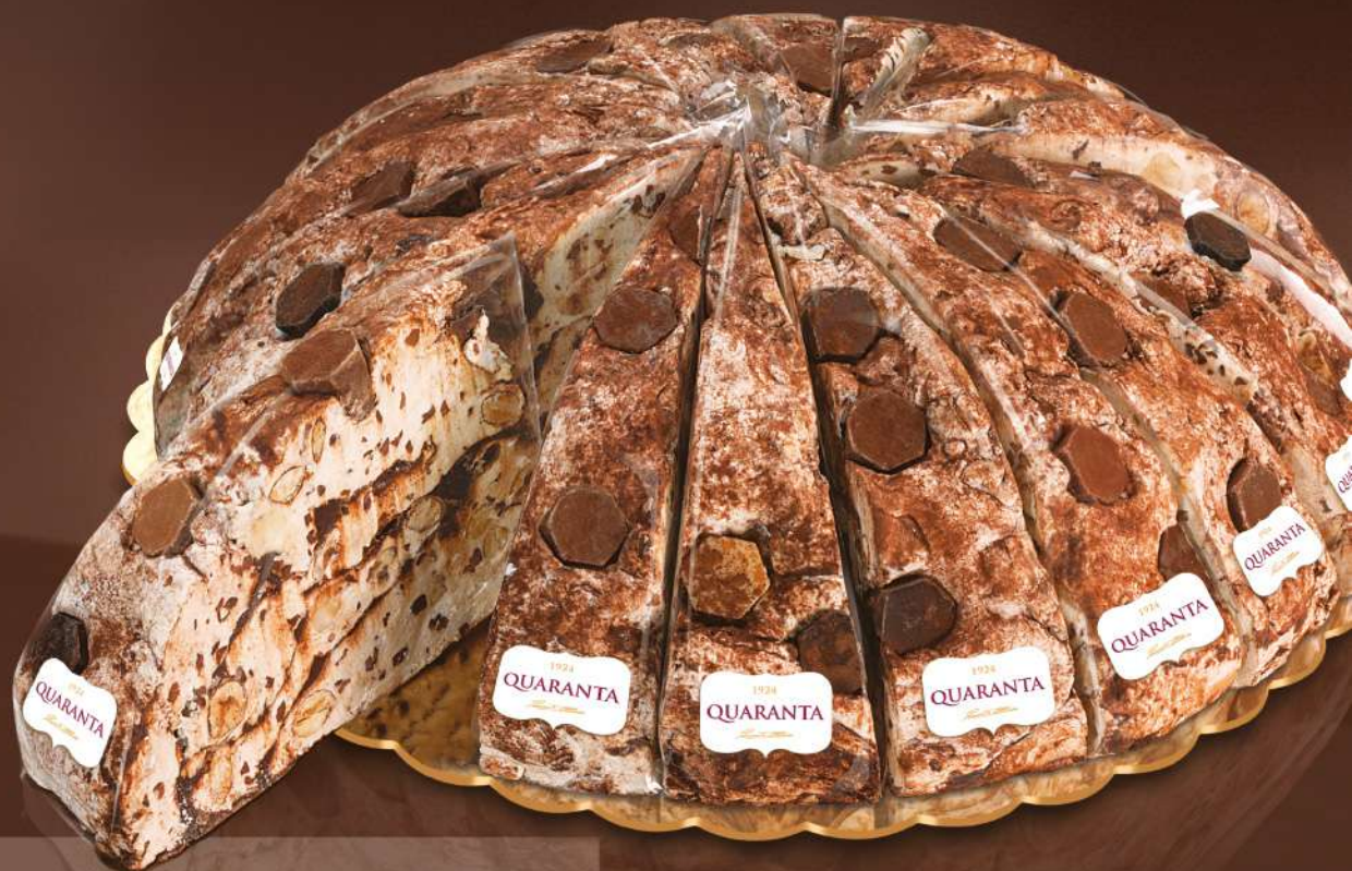
401327 TORTA SOFFICIONA CIOCCOLATO MISTO - INCARTATA 165g - 20 fette - 1 torta per scatola