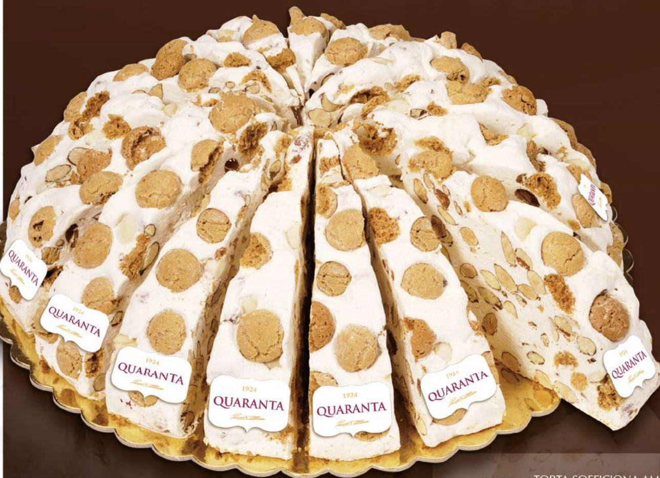
401456 TORTA SOFFICIONA AMARETTO - INCARTATA 165g - 20 fette - 1 torta per scatola