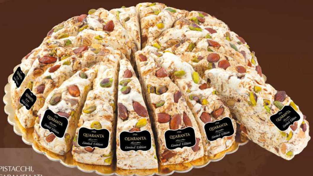
404857 TORTA SOFFICIONA PISTACCHI, MANDORLE E FICHI CAMELLATI 165g - 20 fette - 1 torta per scatola