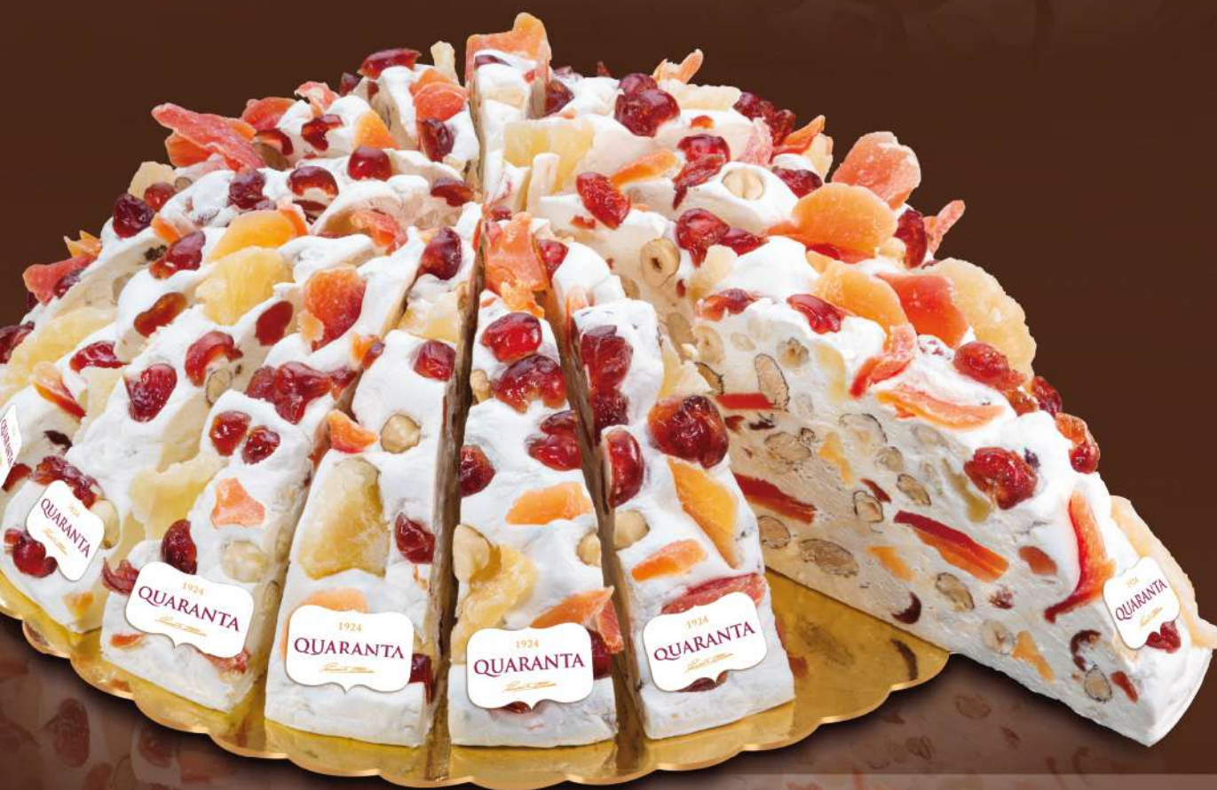
401345 TORTA SOFFICIONA FRUTTA ESOTICA - INCARTATA 165g - 20 fette - 1 torta per scatola