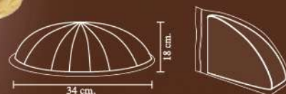
403939 TORTA SOFFICIONA CREME FRUTTA GUSTI ASSORTITI - INCARTATA 165g - 20 fette - 1 torta per scatola