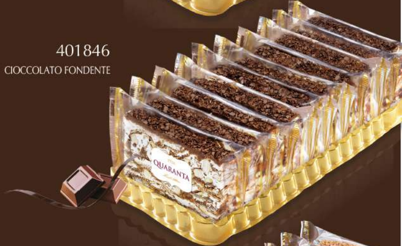
401846 CIOCCOLATO FONDENTE