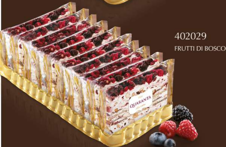
402029 FRUTTI DI BOSCO